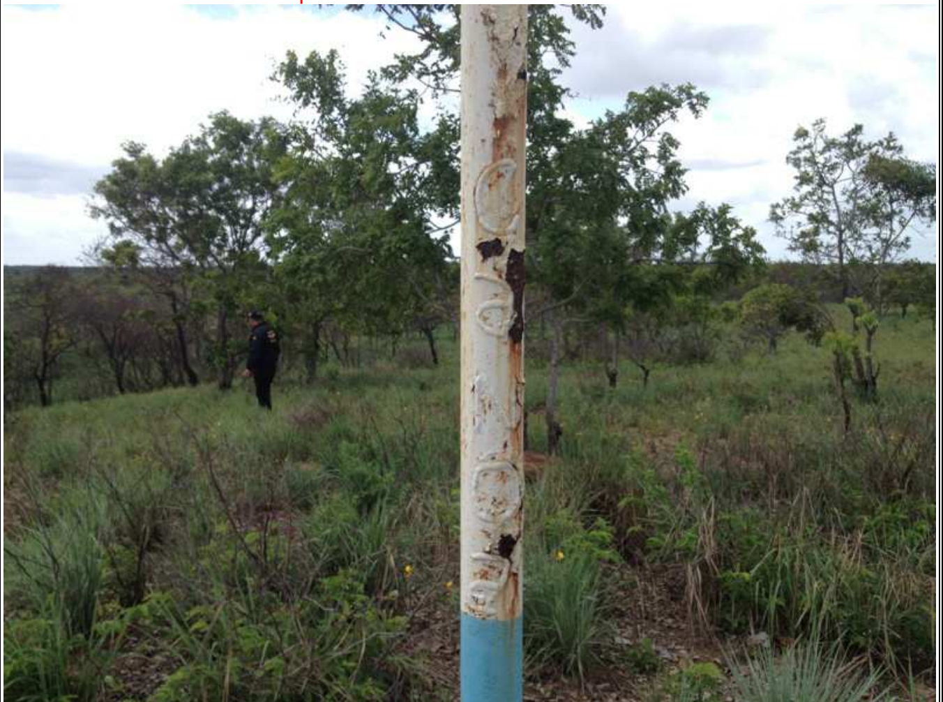
Inscripción del Banderín Indicando La Canoa