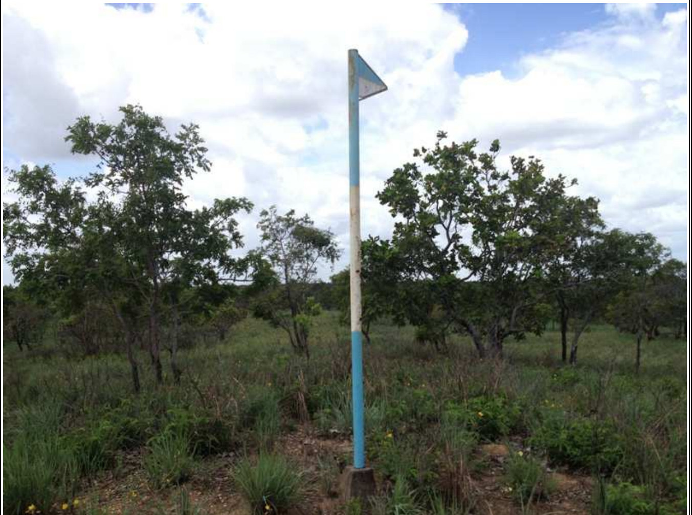
Banderín Indicando La Canoa