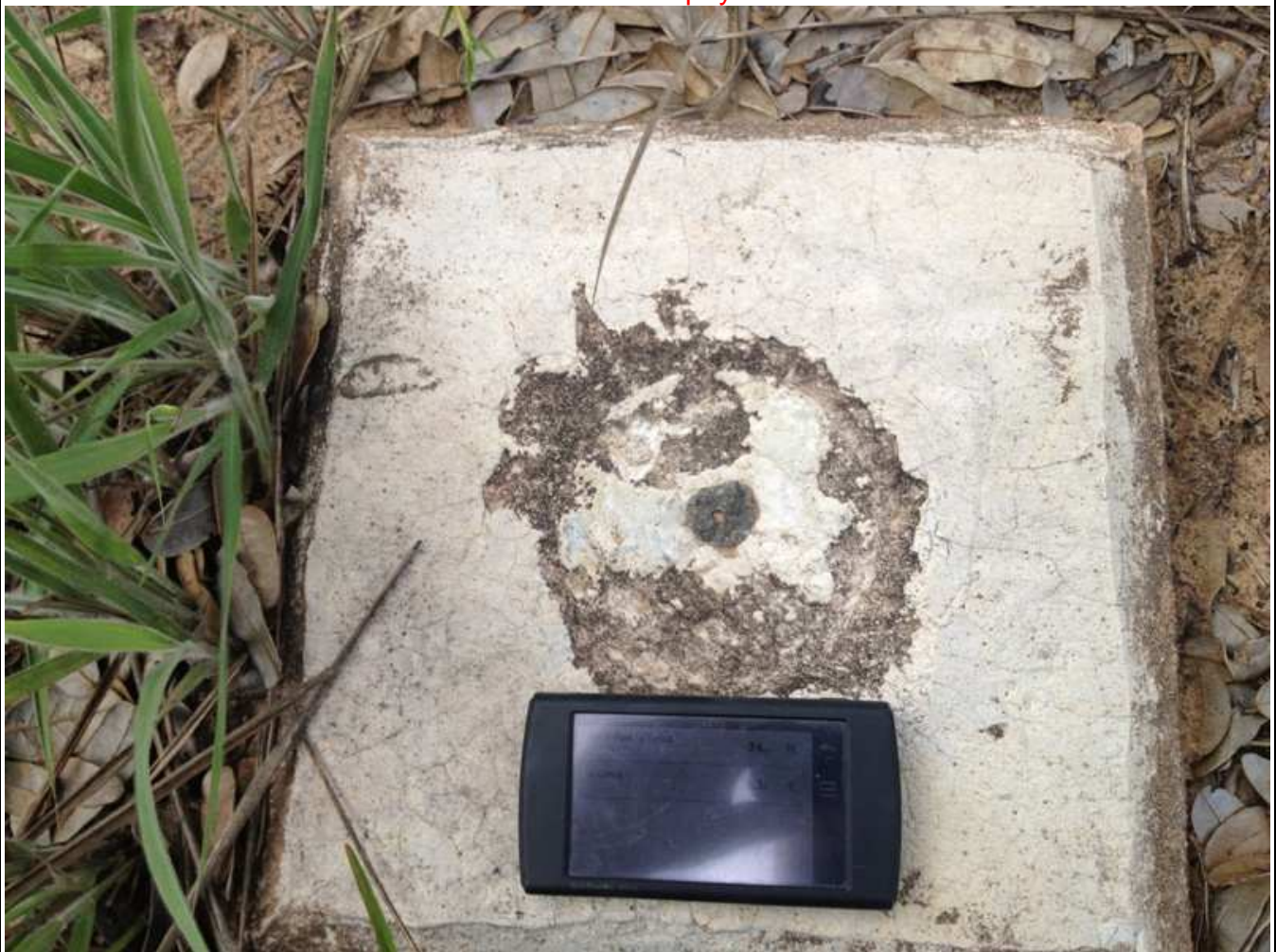
Vértice de Apoyo