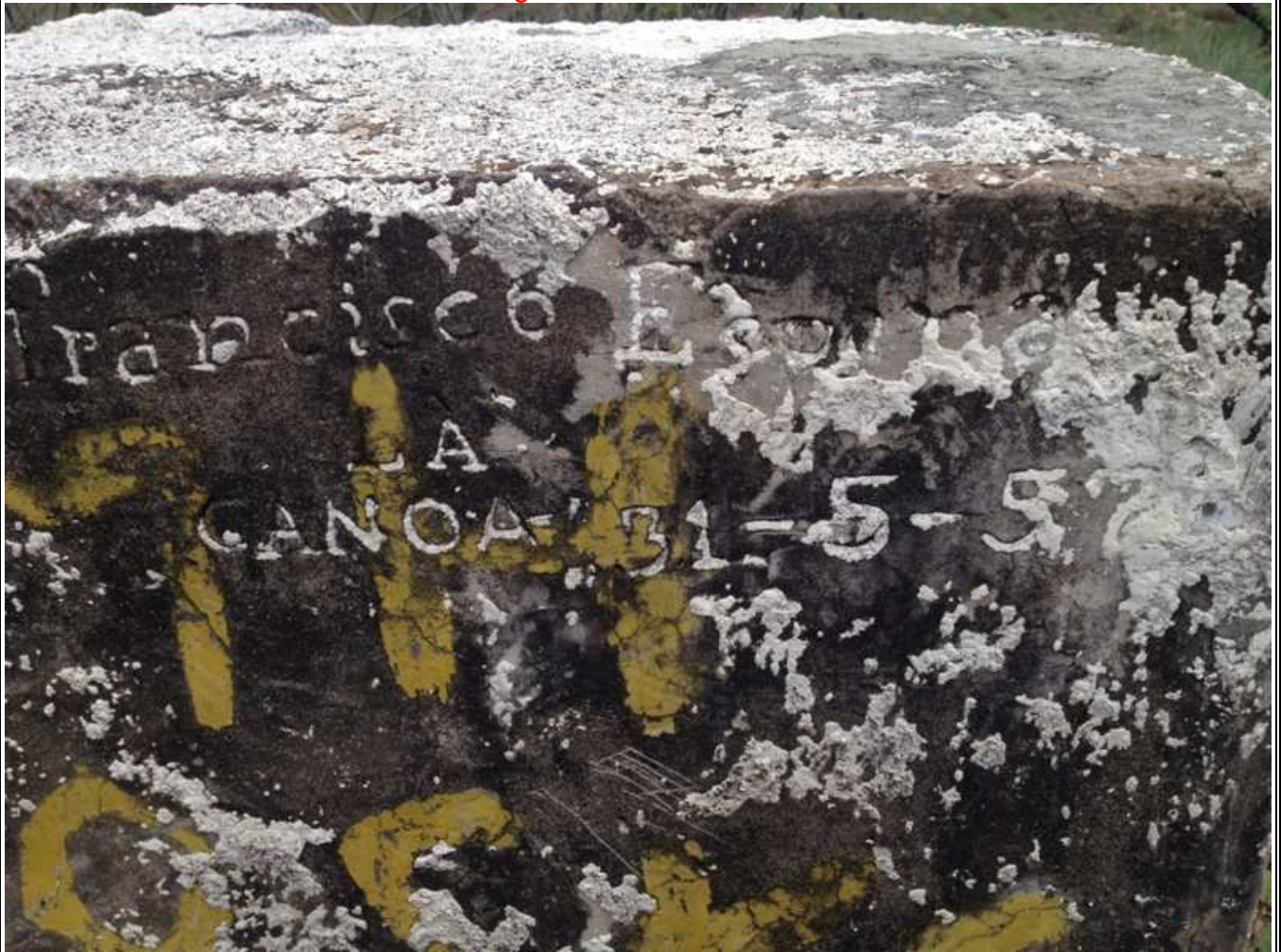
Monumento de la hora legal Venezolana cuando se usaba el GMT -4